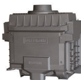
Vue arrière de l'échangeur