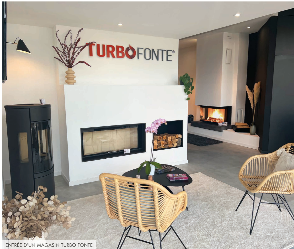
ENTRÉE D'UN MAGASIN TURBO FONTE