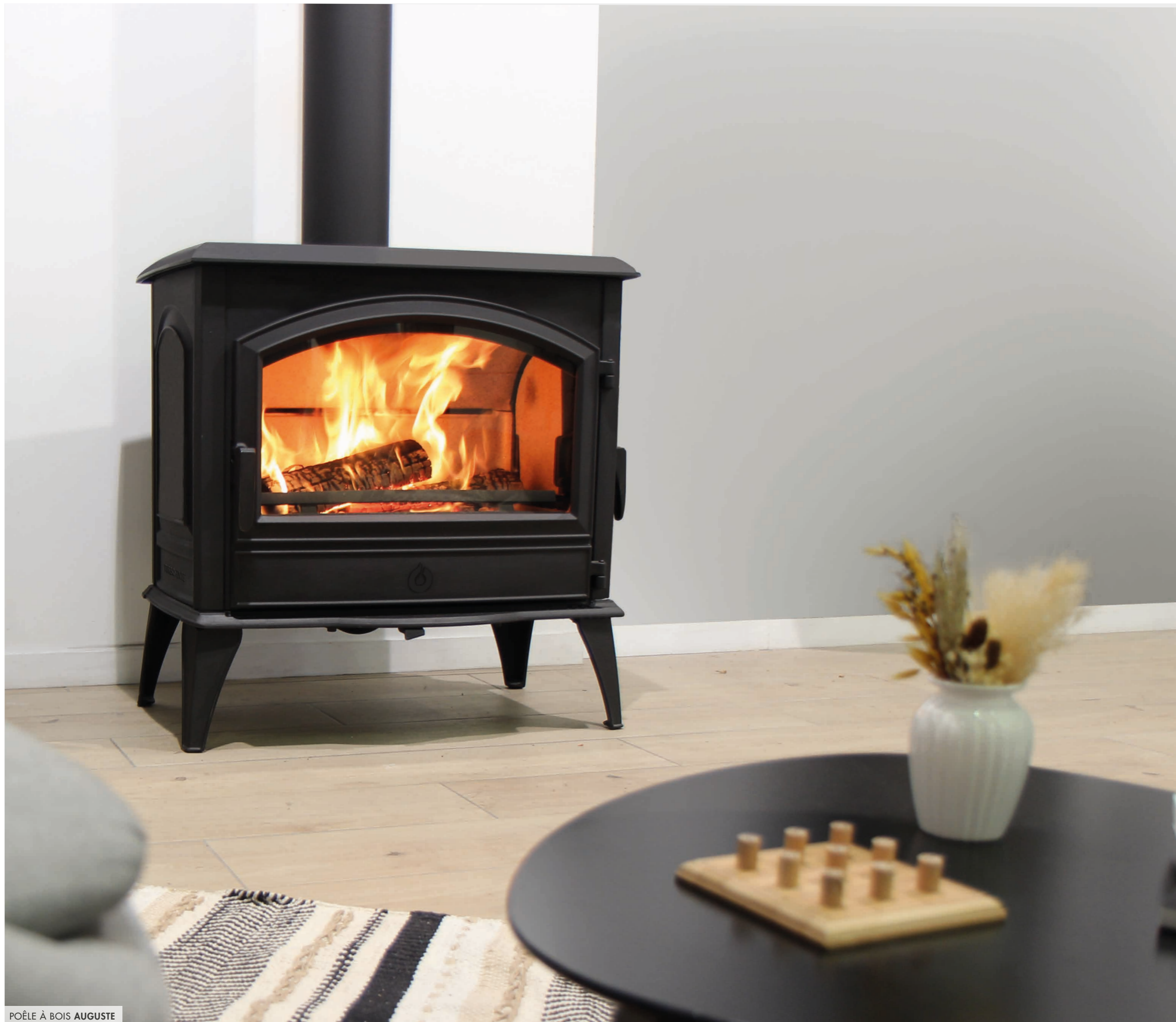
POÊLE À BOIS AUGUSTE