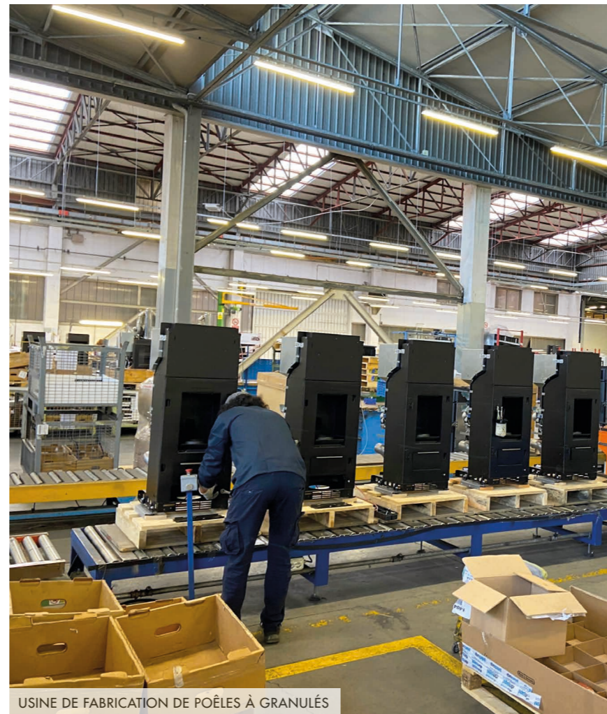
USINE DE FABRICATION DE POÊLES À GRANULÉS