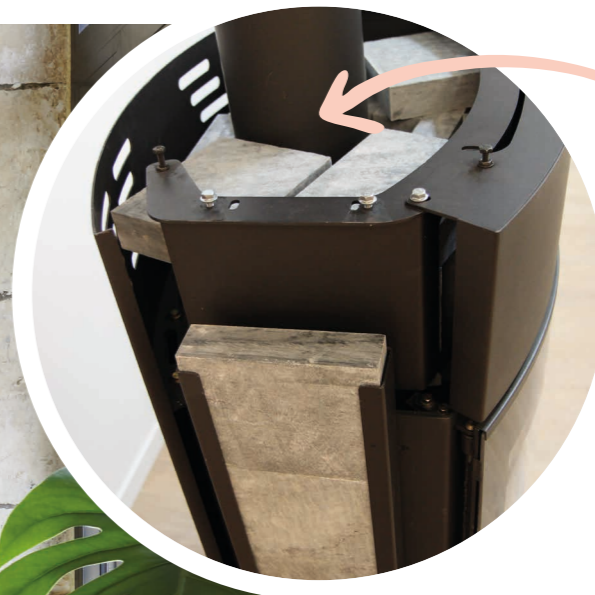
Accumulateurs en pierre ollaire