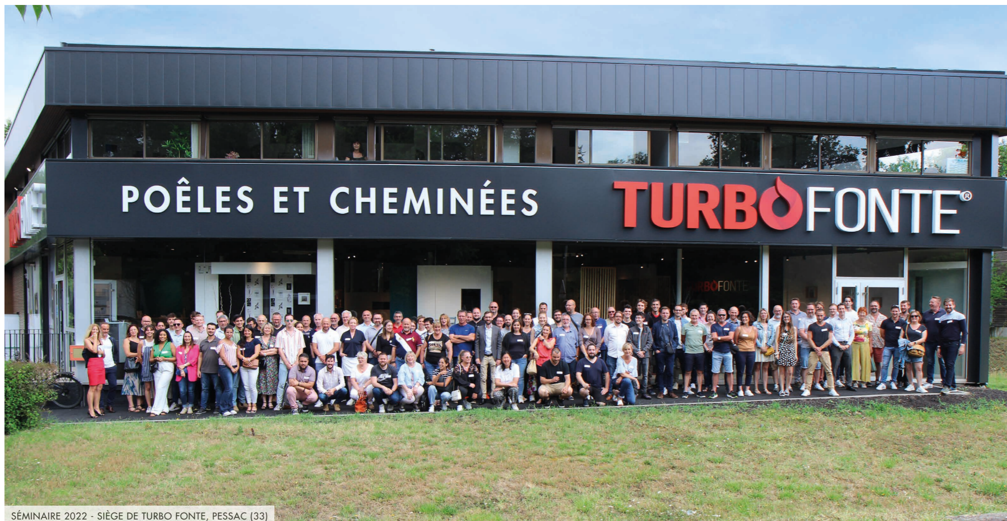
SÉMINAIRE 2022 - SIÈGE DE TURBO FONTE, PESSAC (33)

Avec un chiffre d'affaires en nette progression de + de 112 % en 2 ans , la PME TURBO FONTE associe à son succès le dynamisme de son réseau de concessionnaires qui ne cesse de s'agrandir. Au total ce sont 46 magasins qui maillent le territoire français, 11 de plus sont en cours d'ouverture sur 2023 et déjà 4 futures concessions prévues pour 2024 !