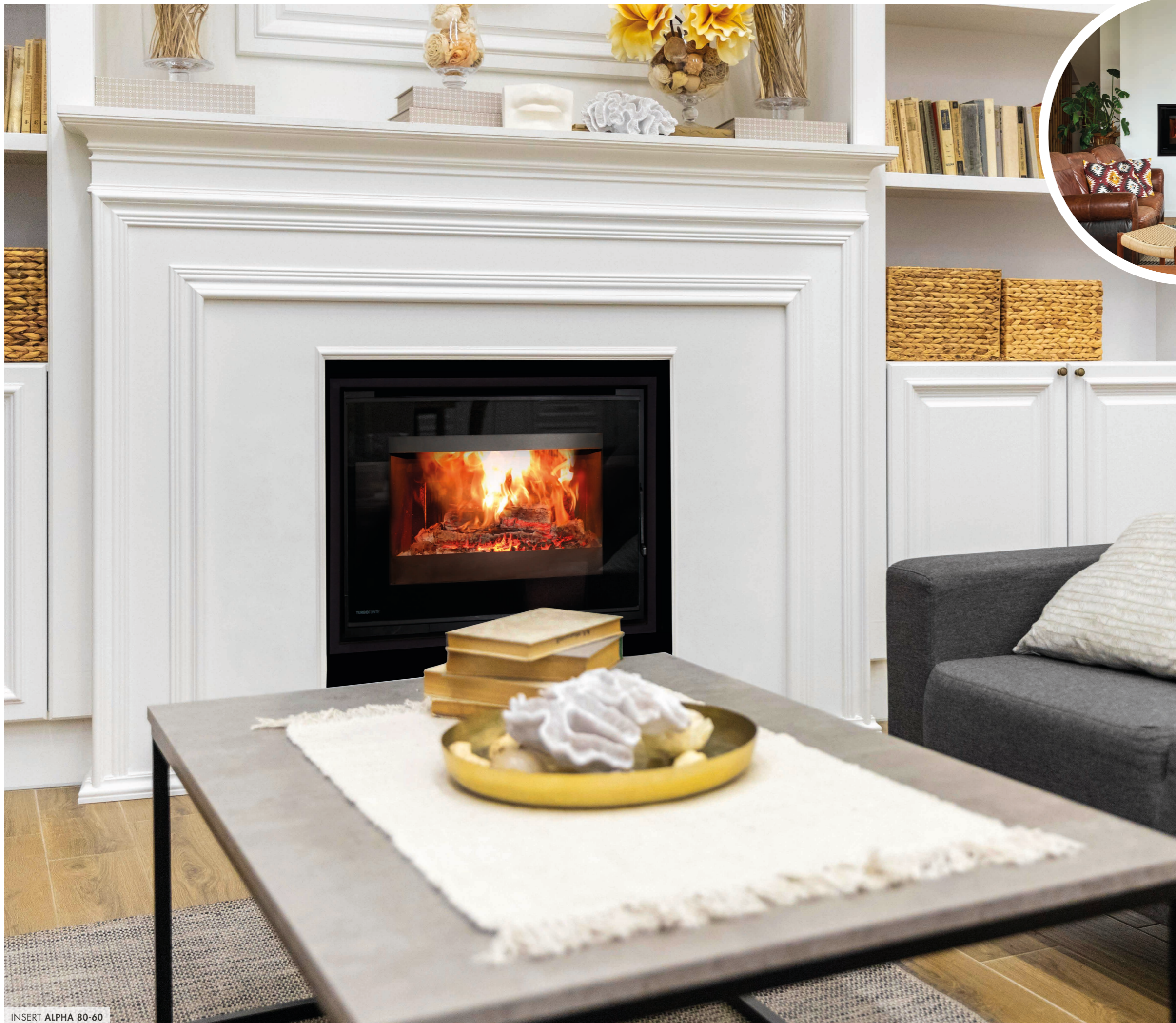
INSERT ALPHA 80-60

L'ALPHA 80-60 existe aussi en FOYER, pour réaliser une cheminée plus moderne !